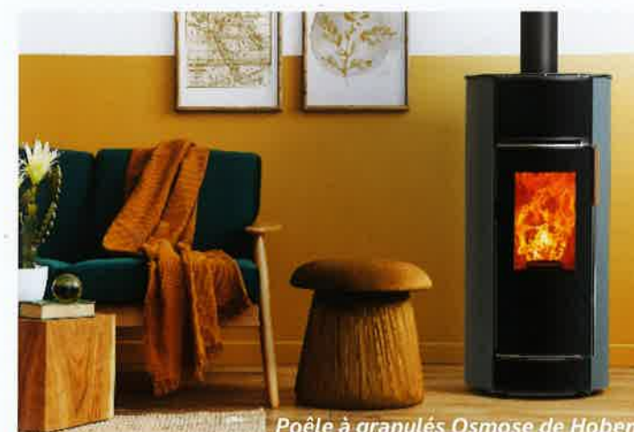
Poêle à granulés Osmose de Hoben

8 Des SAV, proches de chez vous disponibles 5j/7 pour vous accompagner en direct dans vos entretiens.