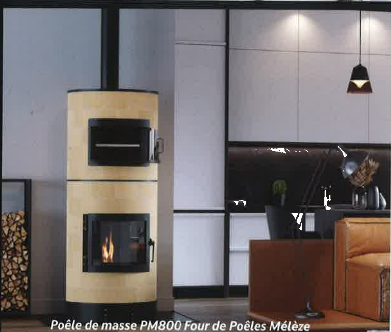
Poêle de masse PM800 Four de Poêles Méléze