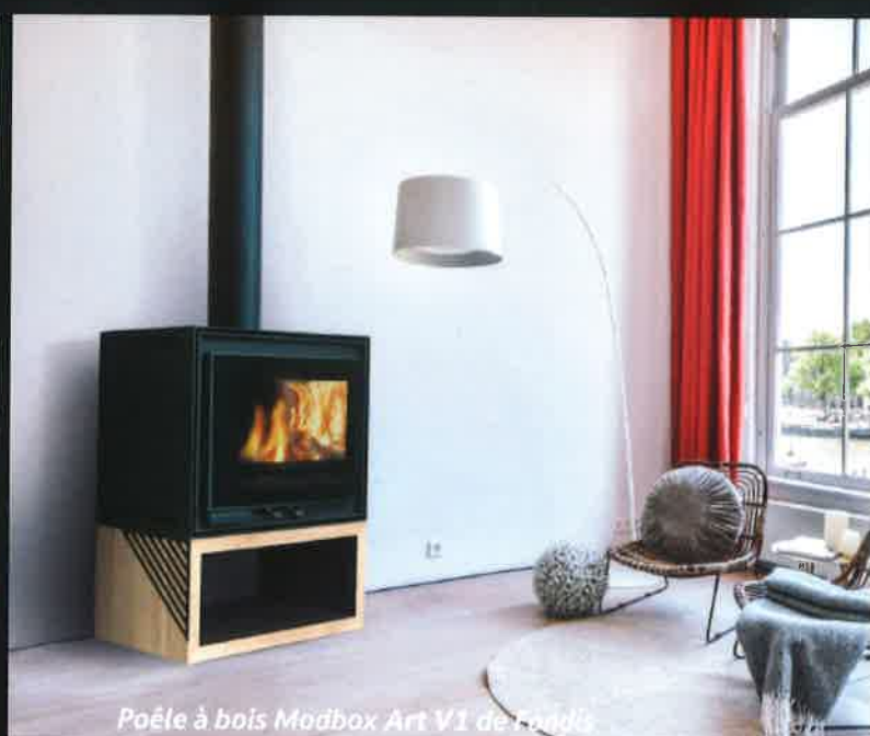
Poêle à bois Modbox Art V1 de Fondis