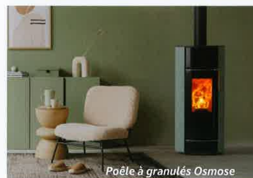
Poêle à granulés Osmose