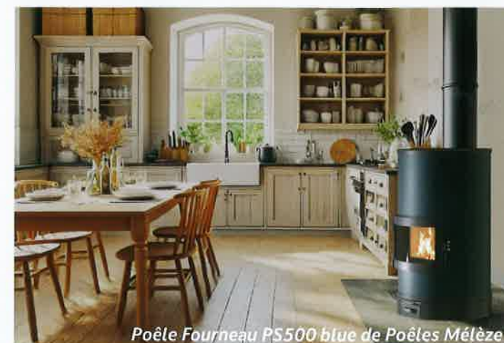
Poêle Fourneau PS500 bleu de Poêles Mélèze

3 Vous séduisez une clientèle à la recherche de produits esthétiques et performants.