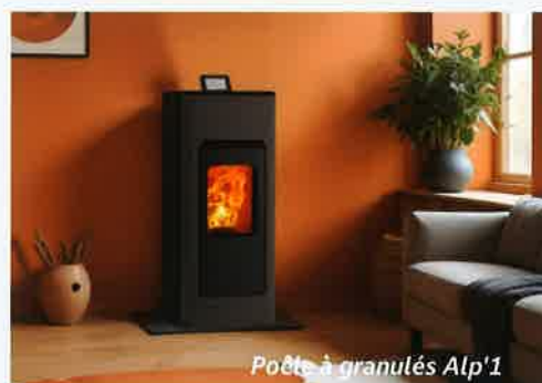
Poêle à granulés Alp'1