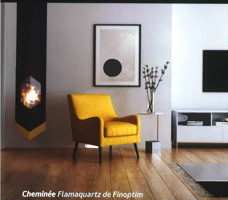
Cheminée Flamaquartz de Finoptim