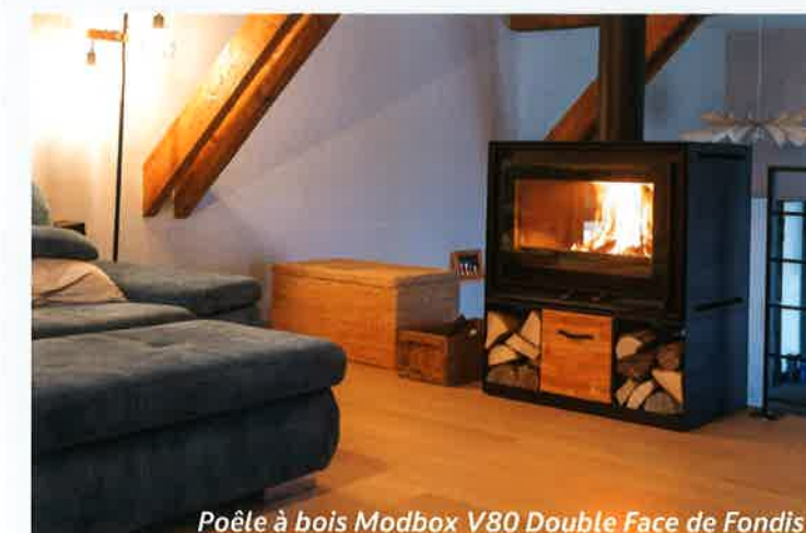
Poêle à bois Modbox V80 Double Face de Fondis

6 Basée sur un partenariat de confiance.