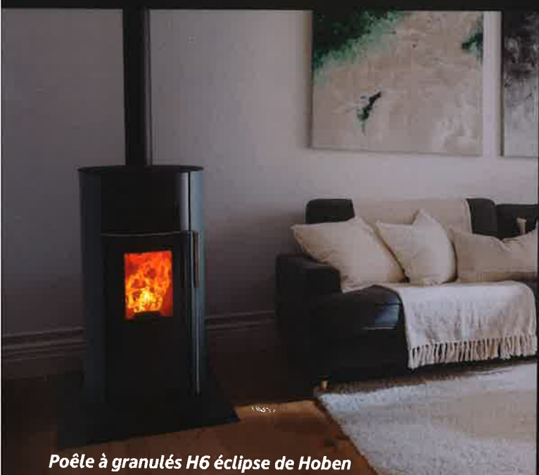
Poêle à granulés H6 éclipse de Hoben