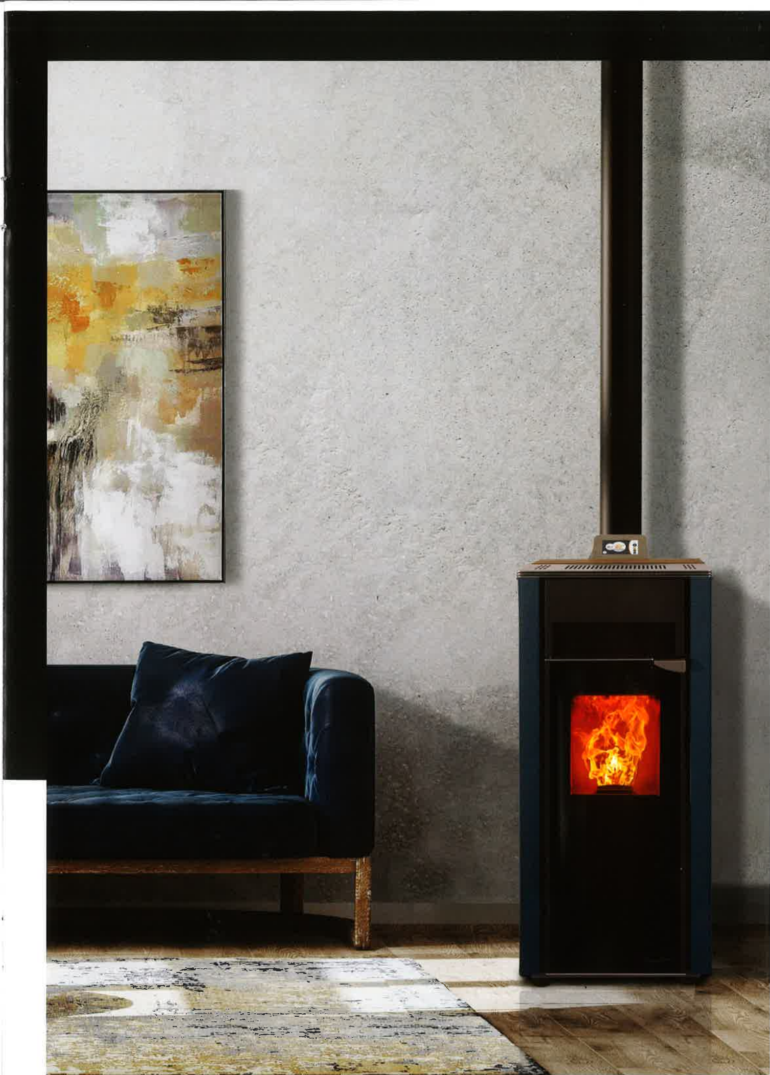
H5 COLOR STEEL